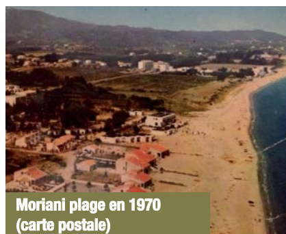
Moriani plage en 1970 (carte postale)