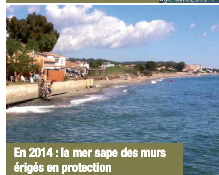
En 2014 : la mer sape des murs érigés en protection