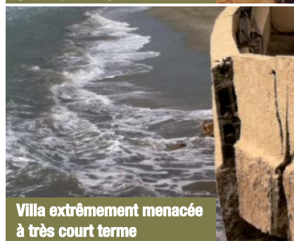
Villa extrêmement menacée à très court terme