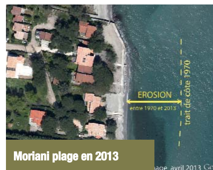
Moriani plage en 2013